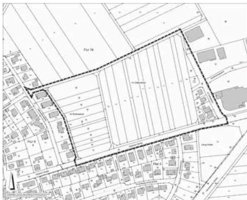
Genordet, ohne Maßstab